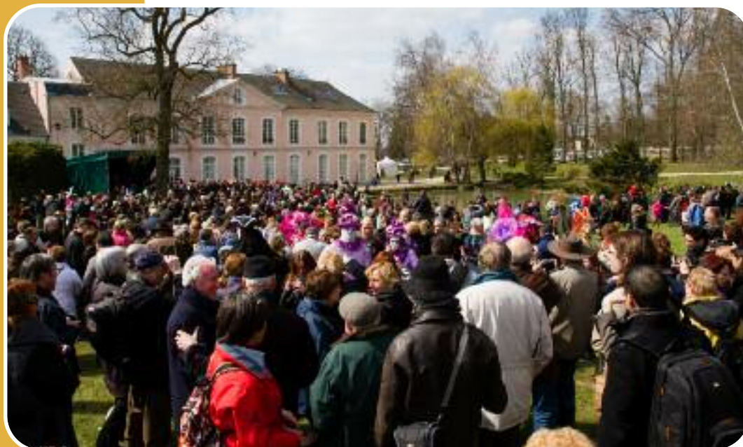
Carnaval vénitien dans le Parc du Château du Grand Veneur à Soisy-sur Seine

férentes : Corbeil et Essonne. La structure fut installée, probablement de manière symbolique, sur les Allées Aristide-Briand, «allée- frontière» entre les anciennes communes, afin de ne créer aucune jalousie ni querelle.