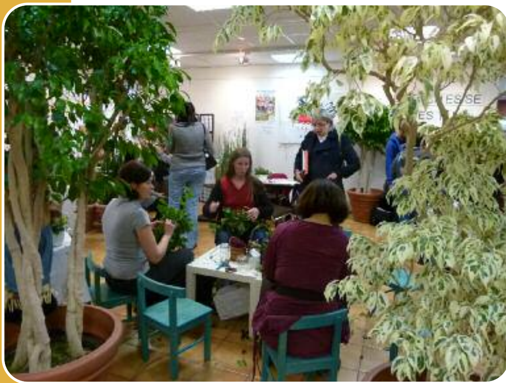
Village NANOUB - Economie Sociale et Solidaire

Élaboré à travers des diagnostics partagés, des débats et des réflexions de groupe, le projet doit permettre une meilleure autonomie, une responsabilisation des jeunes et des moins jeunes au sein de la structure, la création de lien social ainsi qu'une approche active et renouvelée de la citoyenneté.