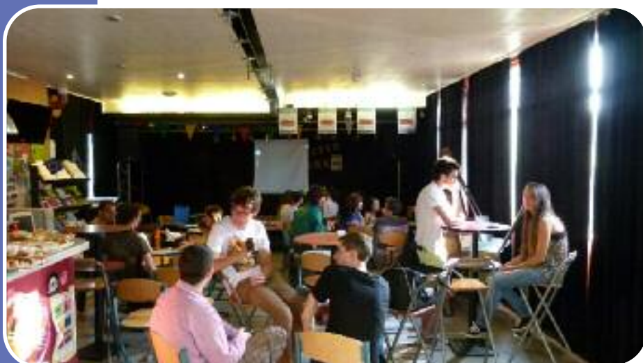
Soirée organisée par des jeunes. Accompagnement de projets et initiatives jeunesse.