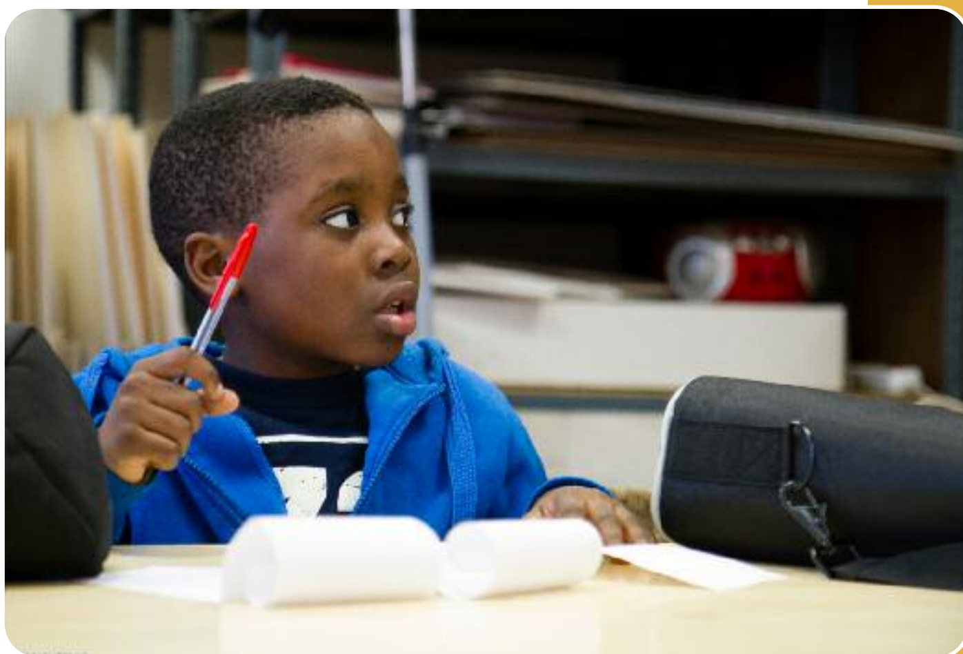
Contrat Local d'Accompagnement à la Scolarité (CLAS)

La MJC est accréditée par l'AFPJA depuis 2012 et jusqu'en 2014 en tant que structure d'accueil et coordinatrice. (accréditation renouvelable)