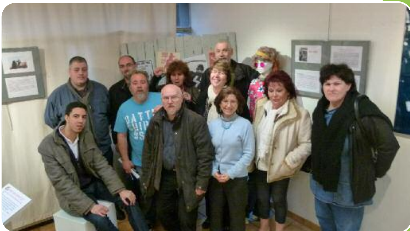
Conseil d'Administration de la MJC Fernand-Léger

La MJC est une association employeuse, à ce titre, elle applique un accord d'entreprise spécifique, qui se réfère à la Convention Collective de l'Animation.