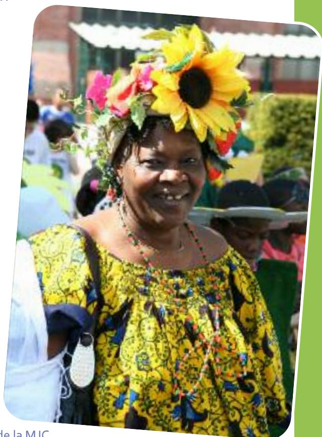
Fête des 50 ans de la MJC

Ils élisent également par tiers les membres du Conseil d'Administration.