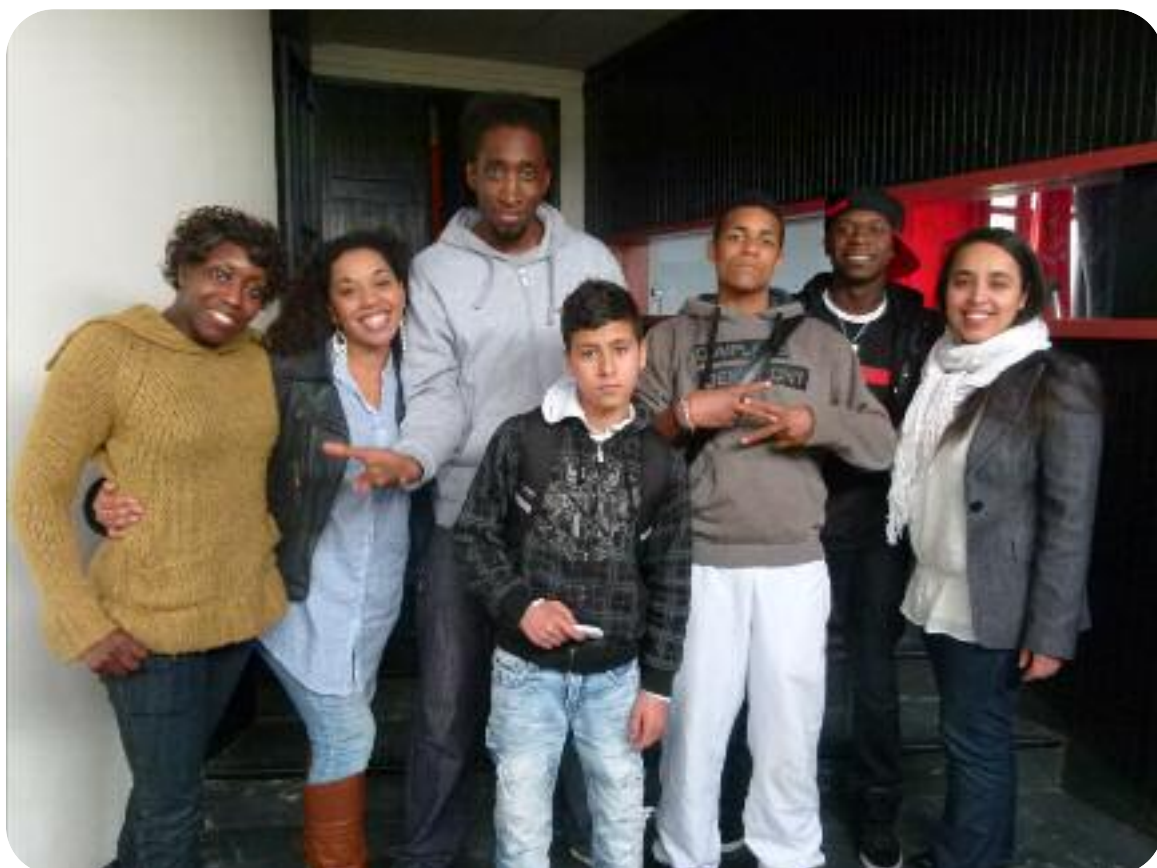
Projet «1, 2, 3 ... Citoyens !» - Egalité Femme / Homme dans le hip-hop

L'accès à l'éducation, au sport et à la culture sont les conditions de l'épanouissement individuel ; ils permettent en effet à chacun de développer ses connaissances et ses compétences, d'appréhender la diversité culturelle comme une ouverture et un enrichissement et de mieux s'insérer ainsi dans les relations sociales et interpersonnelles. Cette meilleure compréhension individuelle de l'environnement, local et global, est un pas vers la prise d'initiatives et l'implication dans les actions collectives visant à renforcer les liens sociaux, à lutter contre toutes les formes d'exclusion et à construire un monde plus fraternel et solidaire.