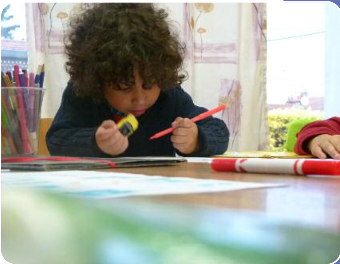
Atelier «English for Kid»

Pour atteindre cet objectif, la MJC devra assumer les fonctions suivantes :