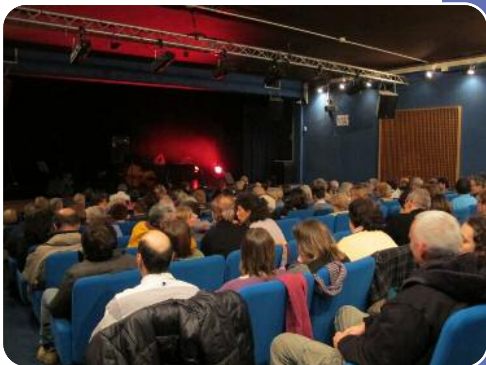
Salle de spectacle