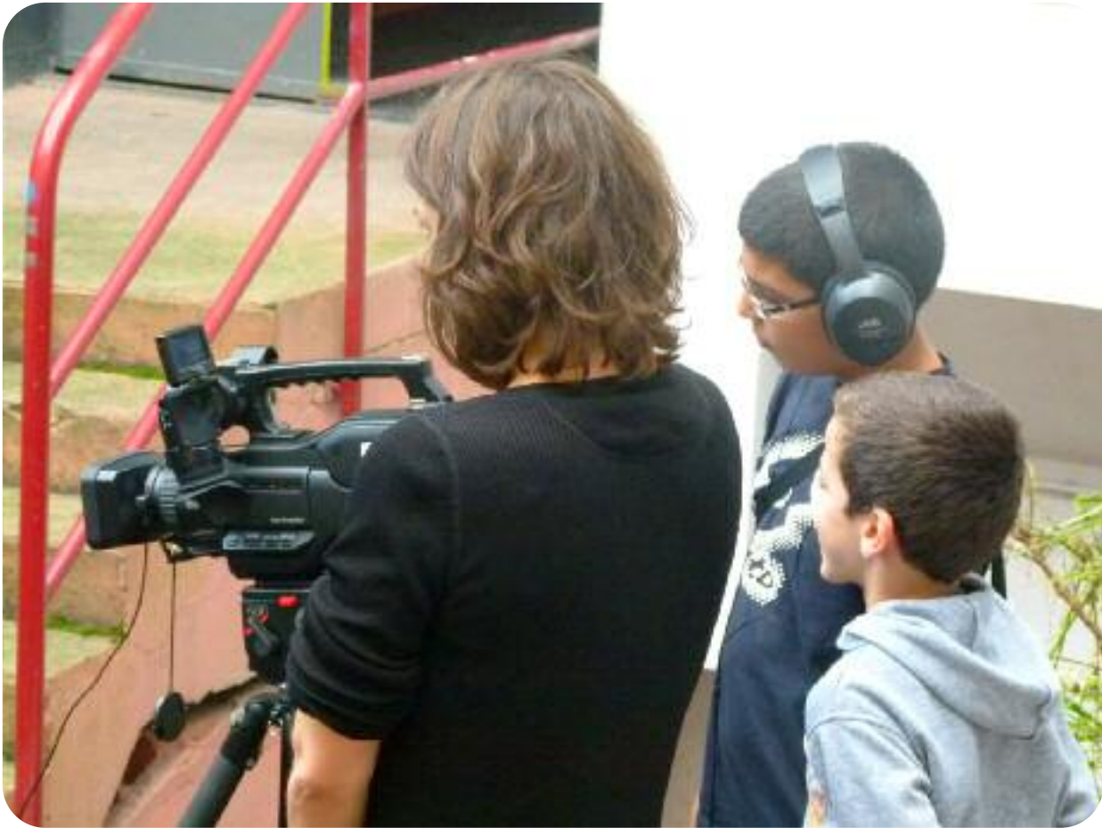
Stage «Vidéo & Citoyenneté - Projet «Café Citoyen»